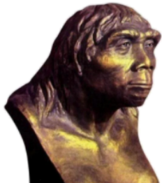
“北京人头部复原像”