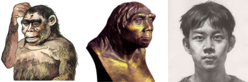
“古猿头像” “北京人头部复原像” “现代人头像”