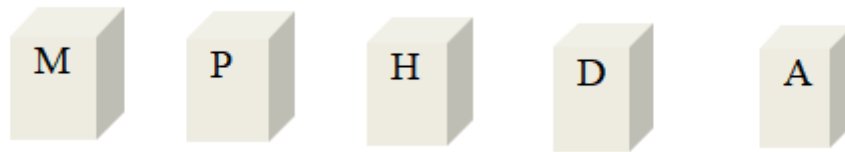
图 1.1 多米诺骨牌理论

M-遗传及社会环境 P-人的缺点 D-发生事故 H-人的不安全行为和物的不安全状态 A-受到伤害