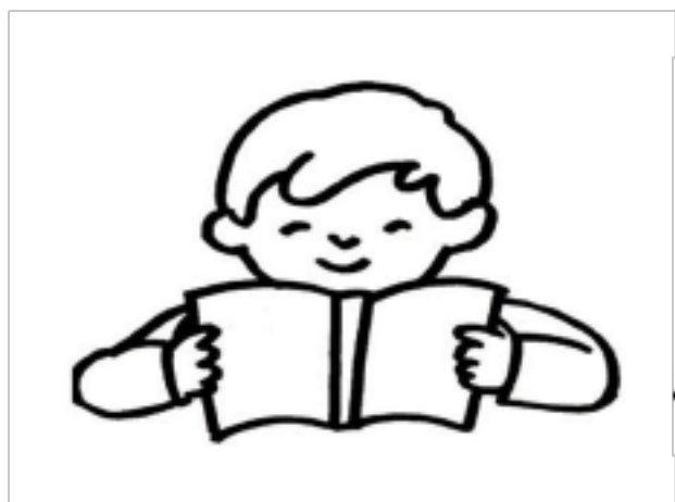
读书 ( )

学校里,有许多你喜欢的地方。说一说在这些地方都喜欢做哪些事情? 把你喜欢做的事情在括号里画“☺”。