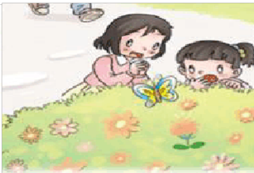
捉蝴蝶 ( )