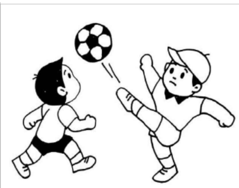
踢足球 ( )