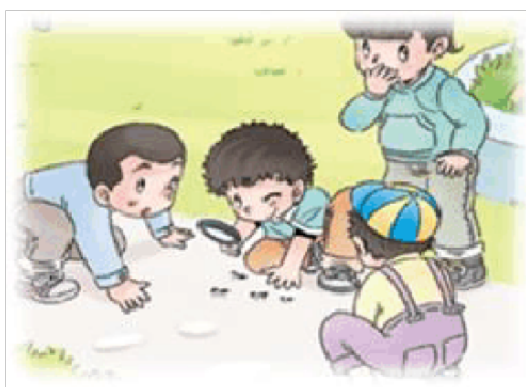
观察蚂蚁 ( )