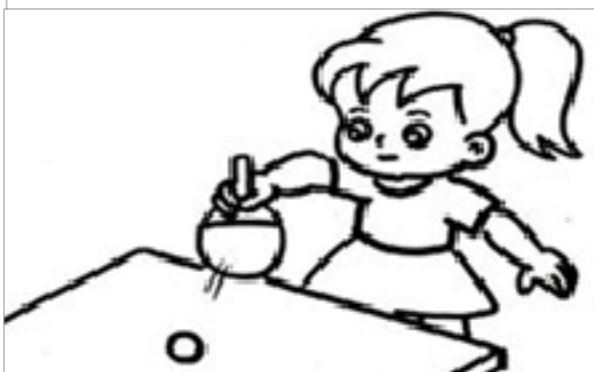
打乒乓球 ( )