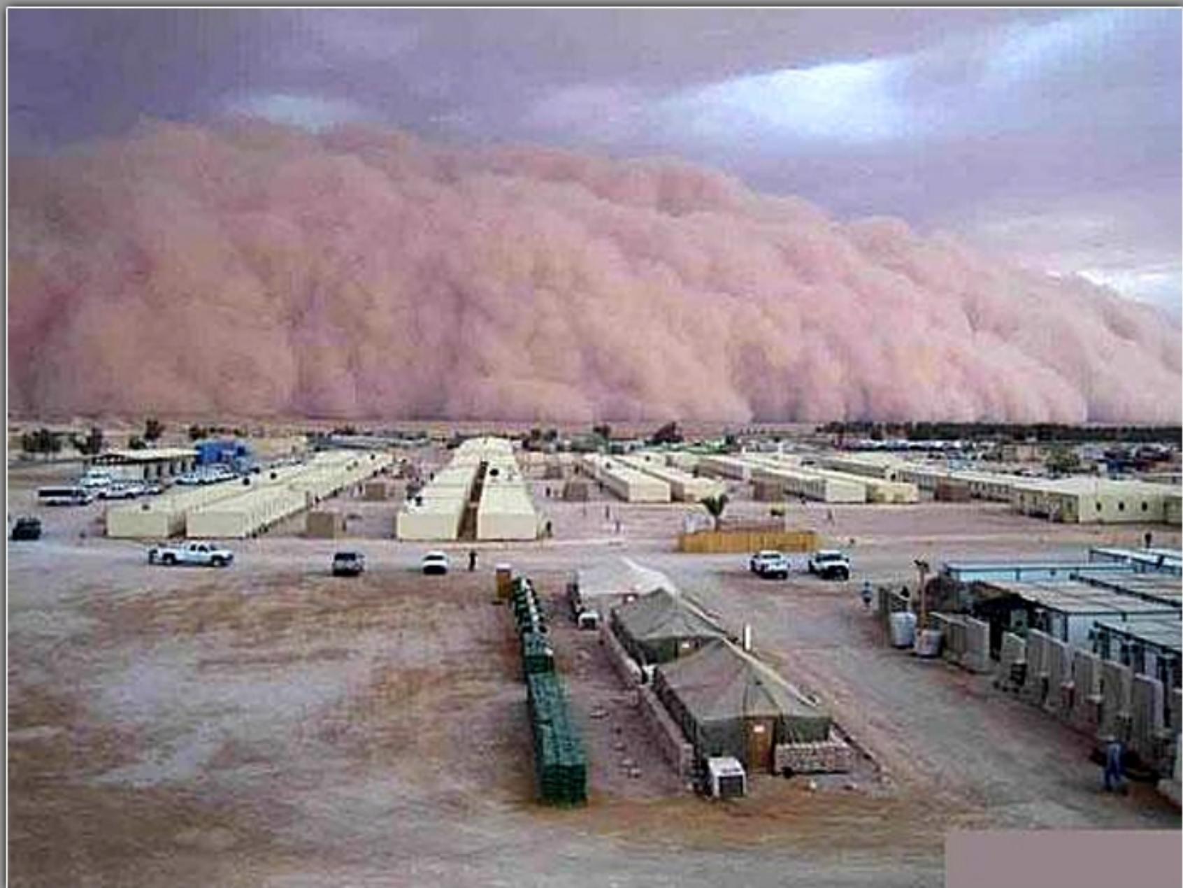
沙 尘 暴