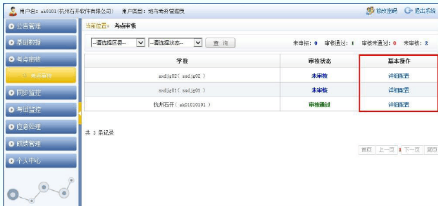
图 8 考点审核