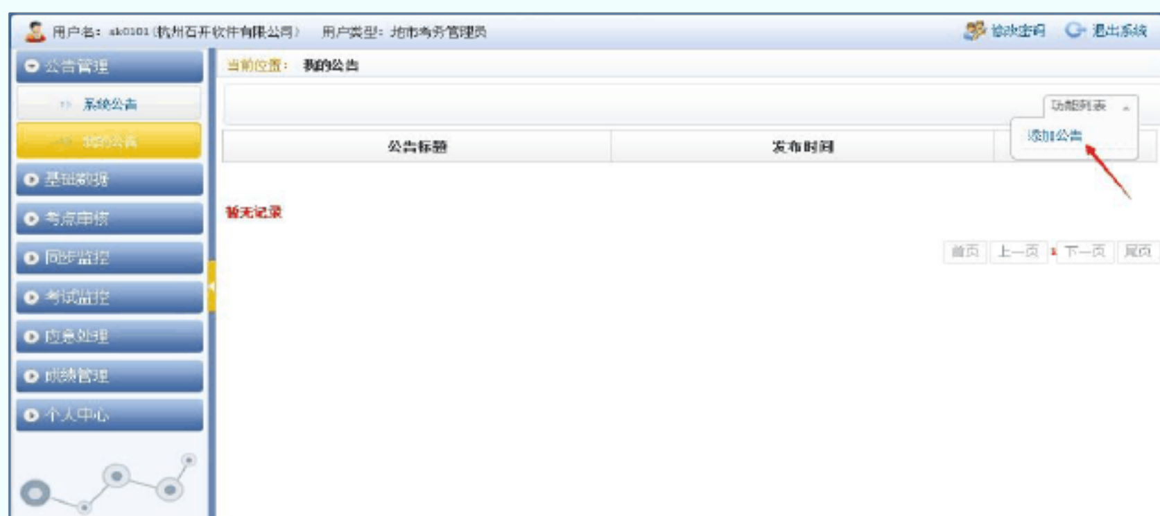
图 3 我的公告

可向本市区县和学校管理员编辑并发布关于本市的公告。发布公告通过点击页面右上角“功能列表”中的“添加公告”实现(如图 3 所示)。