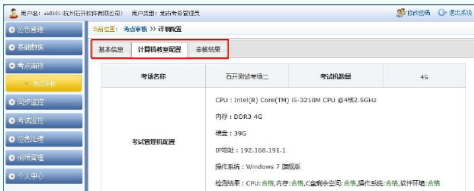
图 9 详细配置