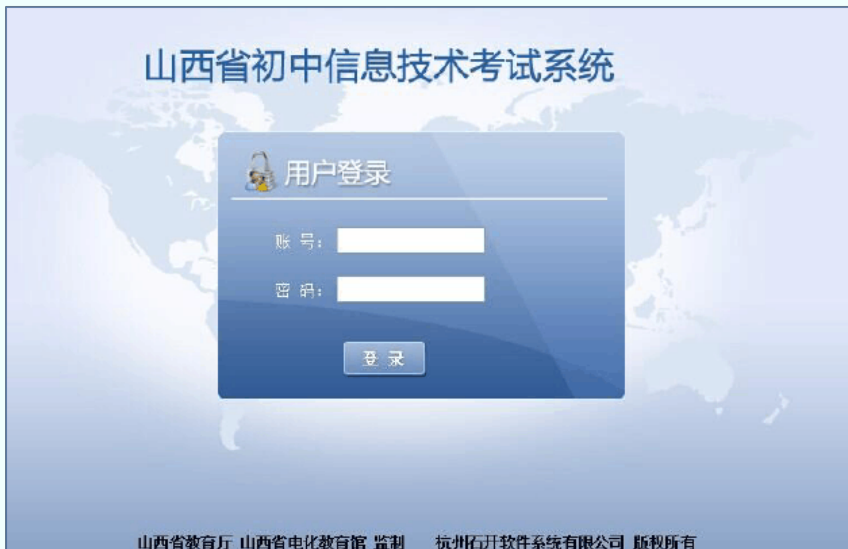
图 1 系统登录