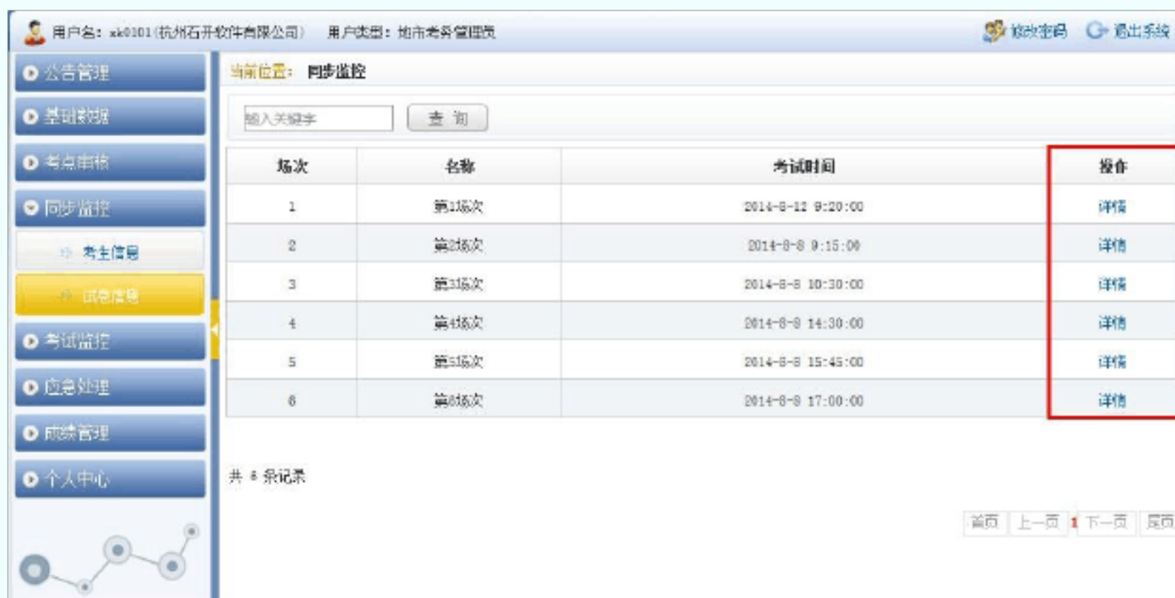
图 11 同步监控