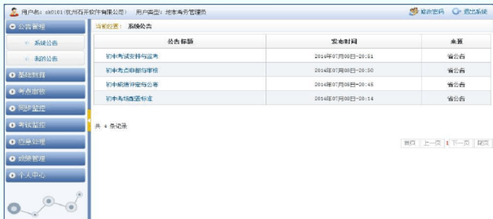
图 2 公告首页