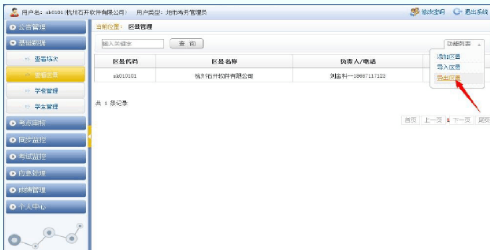
图 5 查看区县

在左侧栏目导航“基础数据”栏目中，点击“学校管理”链接，查看本市学校的详细信息；击右上角的“功能列表”中的“导出学校”按钮，导出本市所有学校管理员的登录账号与密码（如图 6 所示）。