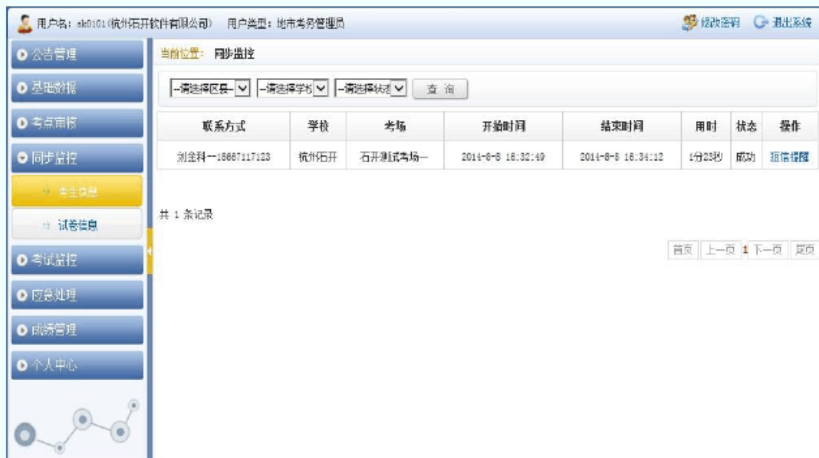
图 10 考生信息

在左侧栏目导航“同步监控”栏目中，点击“考生信息”链接，查看本市所有考点考生信息同步情况（如图10所示）。