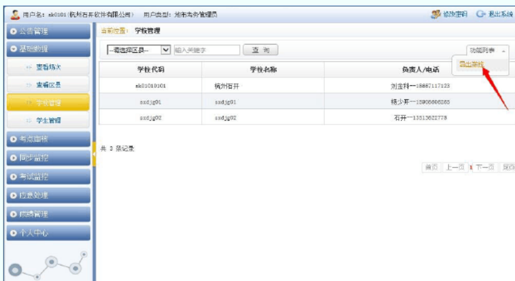
图 6 学校管理

在左侧栏目导航“基础数据”栏目中，点击“学校管理”链接，查看本市学校的详细信息；击右上角的“功能列表”中的“导出学校”按钮，导出本市所有学校管理员的登录账号与密码（如图 6 所示）。