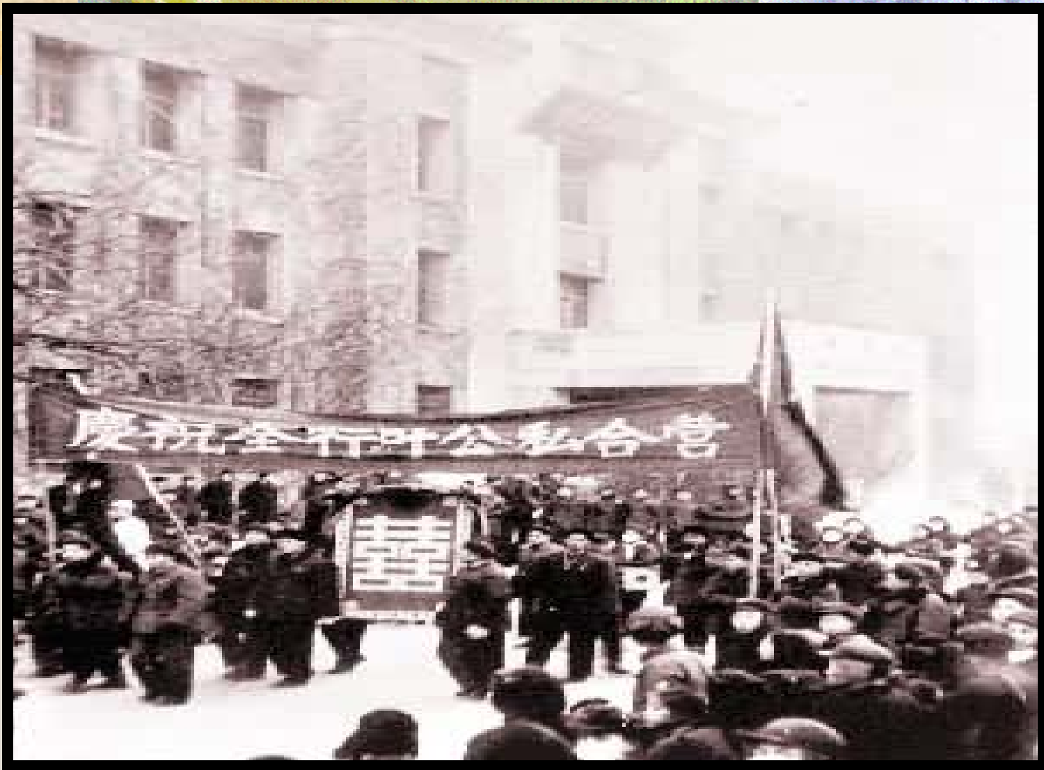
1956年北京人民慶祝公私合營.