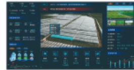
智慧农场灌溉系统