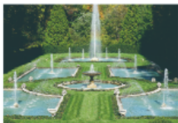
自动喷泉控制系统

有些控制系统的控制过程可以按照预先设定的指令依次执行,不受系统输出的影响,如自动喷泉控制系统、校园铃声铃声播放系统等。