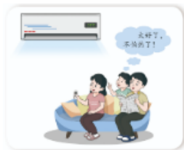
通过设定空调温度实现降温

随意计算机技术的发展,计算机参与的自动控制系统越来越普遍,给人们的生活带来了极大的便利。如空调的自动调节温度、汽车的定速巡航等都有有计算机的参与。