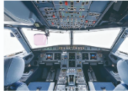
计算机控制飞机完成任务

例如，普通的农场灌溉系统能够实现定时自动灌溉，而智慧农场的灌溉系统通过计算机指令，不仅能根据土壤的水分含量实现自动灌溉，还能根据种植的农作物品种实现分类灌溉。