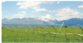
普通农场灌溉系统

例如，普通的农场灌溉系统能够实现定时自动灌溉，而智慧农场的灌溉系统通过计算机指令，不仅能根据土壤的水分含量实现自动灌溉，还能根据种植的农作物品种实现分类灌溉。