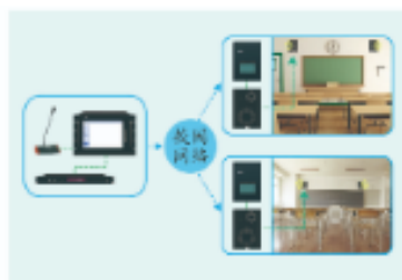
校园铃声播放系统

随着控制技术的的发展,控制系统能根据输出结果自动调整系统的运行,为人们的生活带来了便利。例如,智能路灯能根据外部光线的明暗程度实现自动亮灭,农场灌溉系统能根据土壤水分含量进行自动灌溉。