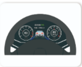
通过设定车速实现汽车定速巡航

计算机是自动控制系统的关键组成部分,它可以实现快速、准确、可靠的控制功能,从而提高系统的效率和精度。