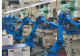
计算机控制机床自动运行