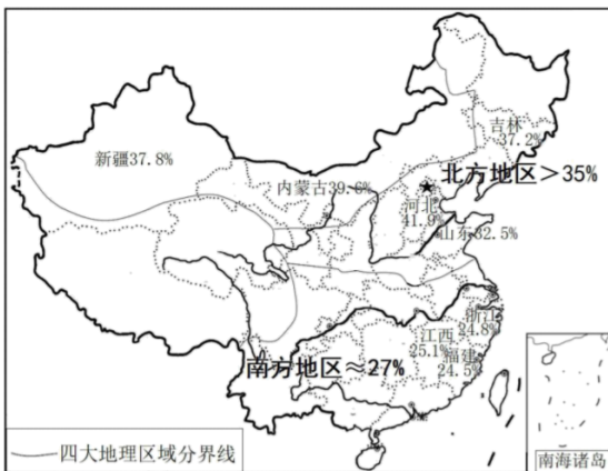
图 1：2017 年中国肥胖情况部分区域分布

2016 年，英国著名医学杂志《柳叶刀》的全球成年人体重调查报告显示：全球成人肥胖人口已经超过瘦子，而中国超越美国，成为全球肥胖人口最多的国家。