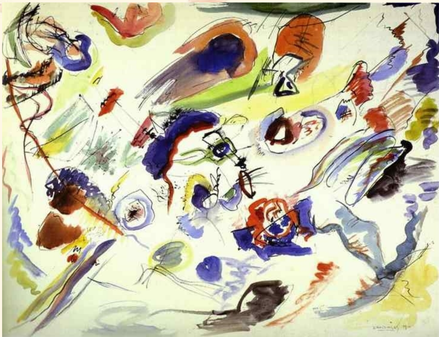
康定斯基的第一幅水彩抽象画 1910