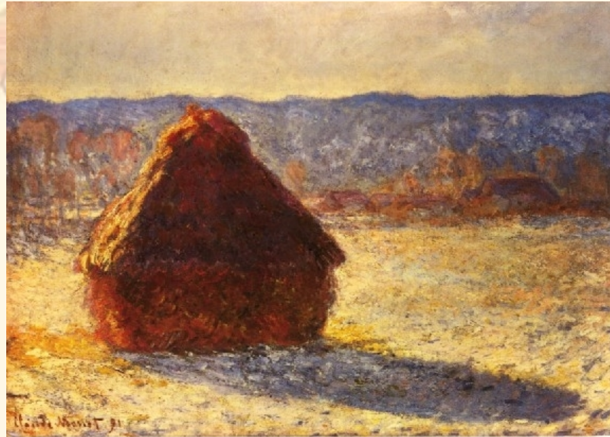
(Morning Snow Effect)