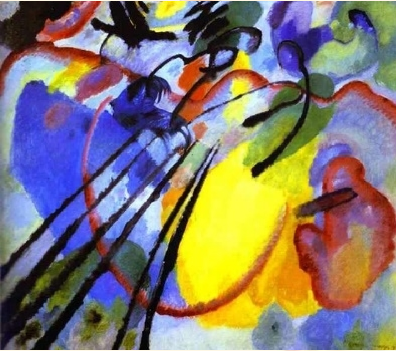
即兴26，布面油画，1912 42.1”x 38.2