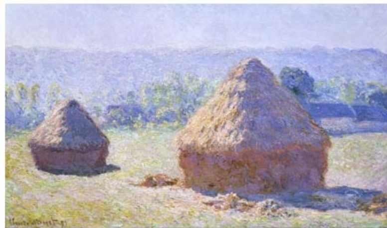
The End of the Summer, at Giverny, 1891

有一天30岁的康定斯基去看画展，展出的是莫奈的《干草堆》，但是他没认出来是草垛，因为画的太潦草了。他觉得画不应该是这么潦草的，可是很奇怪，这张画一直在他脑海印象特别深刻。这件事让他感到很吃惊。经过这次画展，他开始明白了，原来画画也可以不用那么逼真。《干草堆》启发了他离开俄罗斯去德国学习艺术。