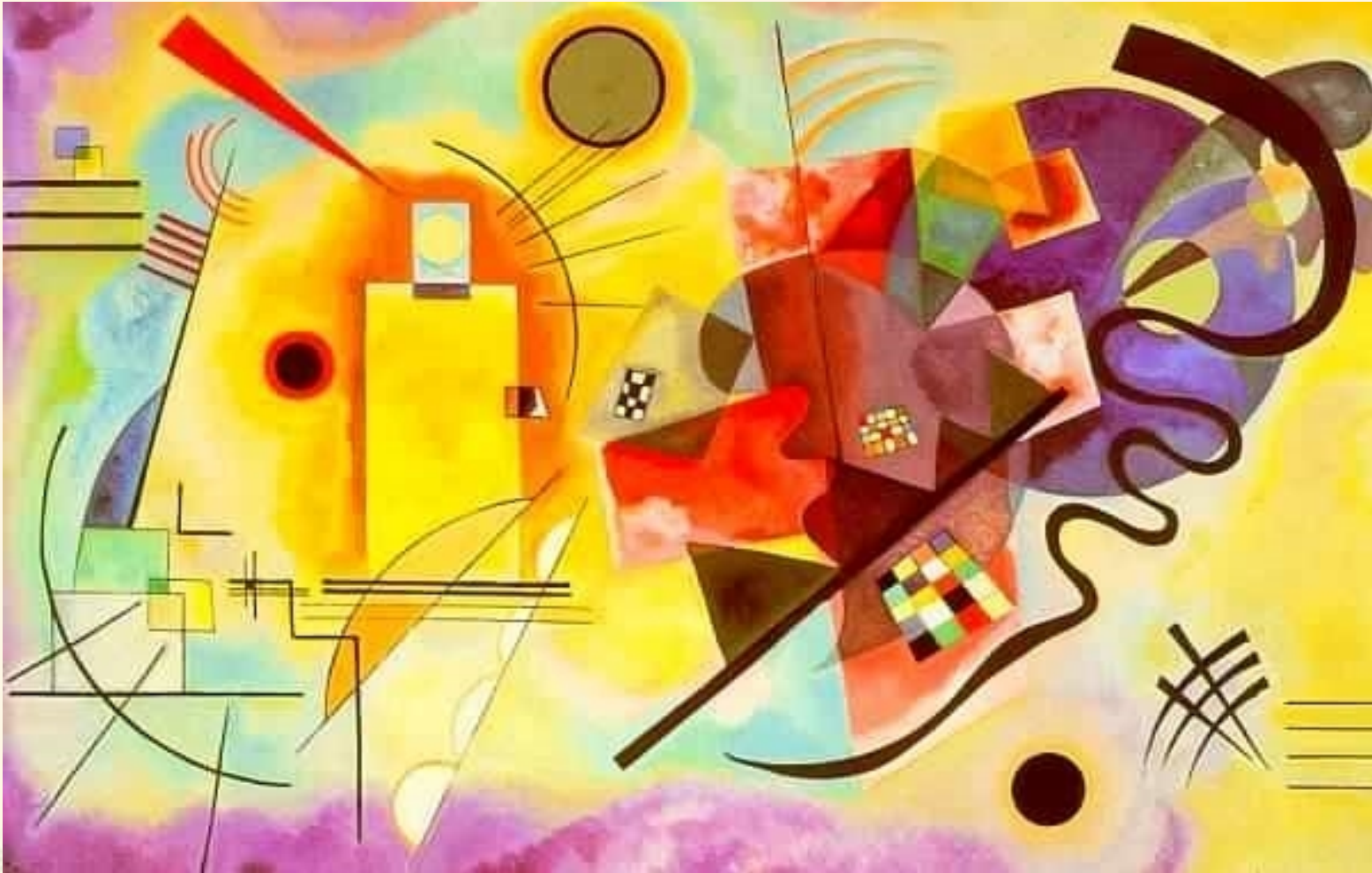
《, 蓝 》 1925