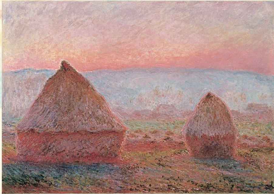
Claude MONET 1840–1926 Haystacks at Giverny, the evening sun 1888