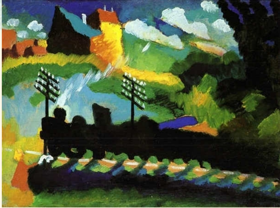
观看铁路和一座城堡，1909