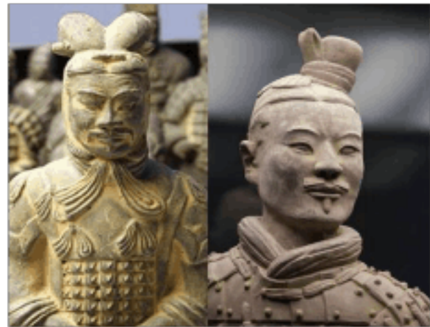
神态各异的秦始皇陵兵马俑（部分）