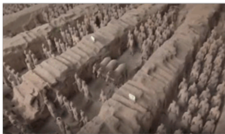
兵马俑一号坑中气势宏大的军阵