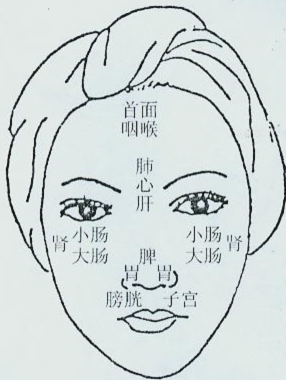
图 36 面部脏腑特定反应区示意图