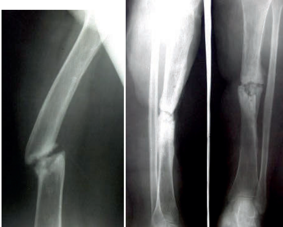
图 3、术前 2003 年 10 月 17 日 X 光片。左股骨骨不愈合，断端硬化，畸形。图 4、左胫骨正侧位片，显示骨不愈合。