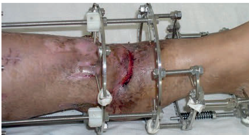
图 9，术后 3 个月完成骨延长及皮肤延长。