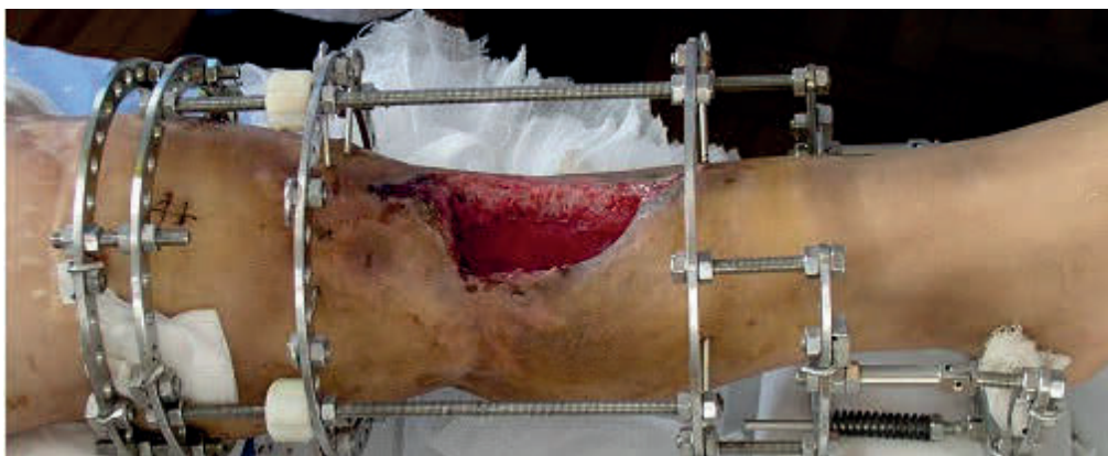
图 8，手术中照片，切除病灶及病骨后，巨大的骨创面留置。做骨延长的同时也做皮肤延长。