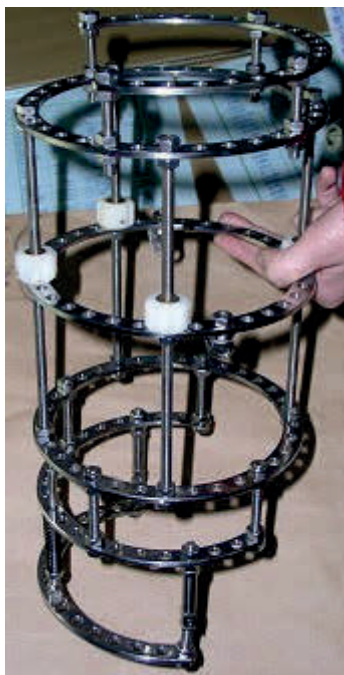
图 7，左胫骨应用的 Ilizarov 外固定架，该架不仅能做骨延长手术，而且对踝关节畸形也能得到矫正。