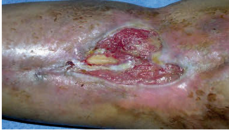
图 1、术前左小腿大体照，骨外露，皮缺损，假关节。图 2、术前大体局部照，显示皮肤缺损 6×8cm，骨外露。