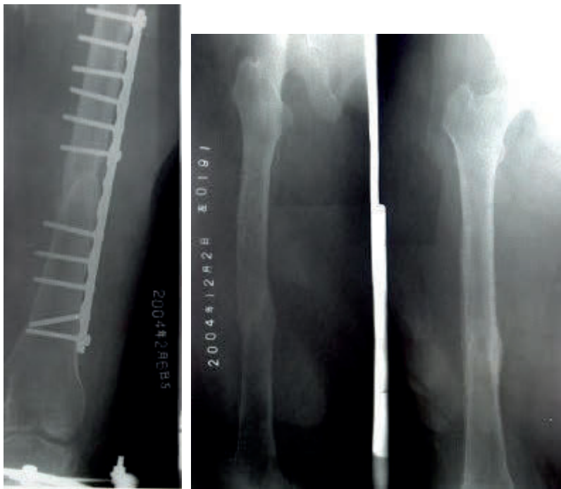
图 6、术后钢板内固定及四个月骨坚强愈合，拆除钢板。