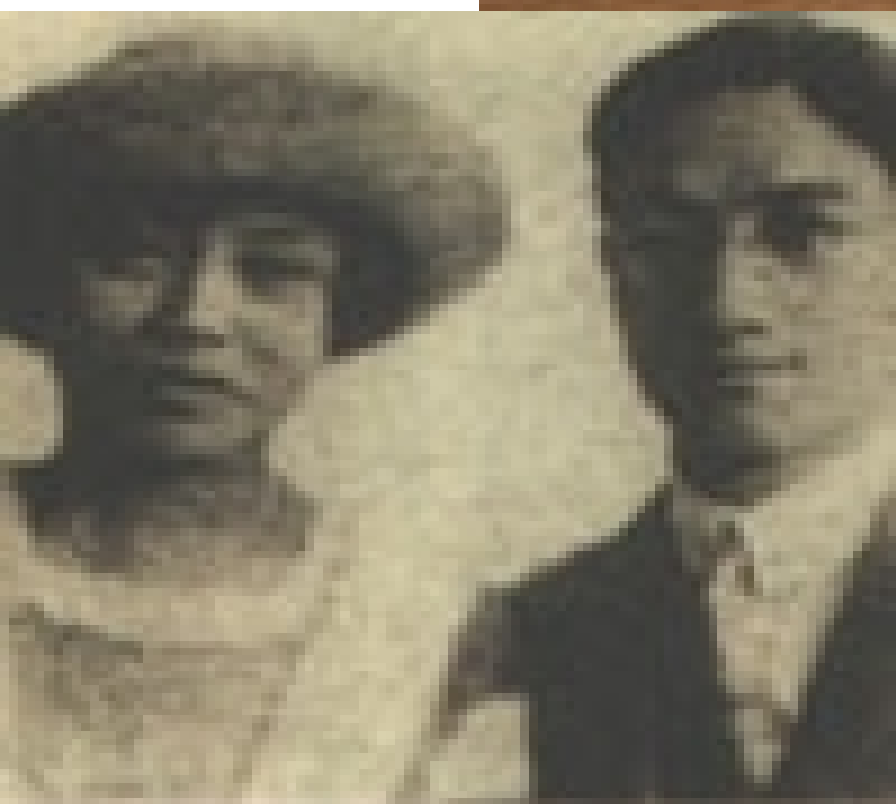
李摩与张幼仪（1921年，巴黎）