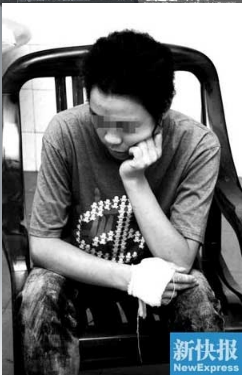
受害其中一名伤者抢救的情景