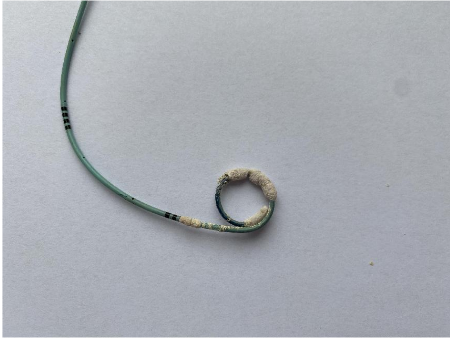
图 2 结壳组