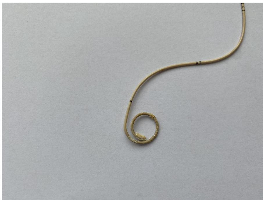
图 1 结壳组

膀胱镜下双J管取出术：患者采取截石位，消毒铺巾后，使用达克罗宁凝胶行尿道粘膜局部麻醉，经尿道口置入膀胱镜，顺利进镜。见膀胱各壁粘膜光滑，无憩室、小房小梁形成，膀胱颈口及三角区无充血水肿，未见新生物，双侧输尿管口位置正常，呈裂隙状，目标输尿管口处见双J管尾端在位，置入异物钳钳夹双J管尾端，退镜，将其完整取出。待拔除的双J管常温下自然风干后，选出结壳组和无结壳组，双J管结壳判定标准：肉眼看见或者手能触摸到双J管表面或管腔内结壳形成。