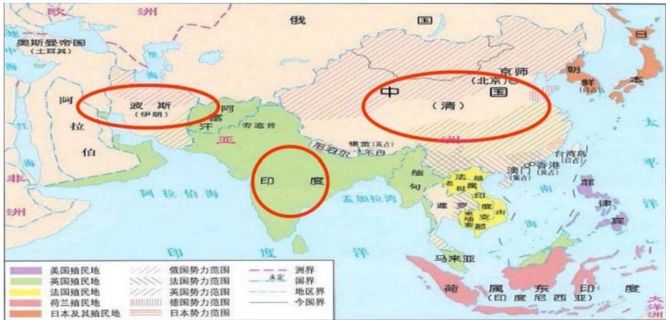
▲ 列强在亚洲的殖民地和势力范围(19世纪末20世纪初)