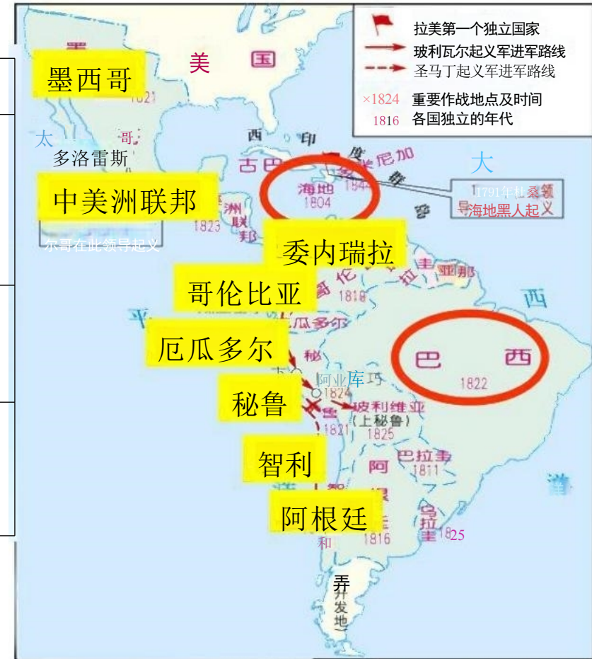
拉丁美洲独立战争形势图