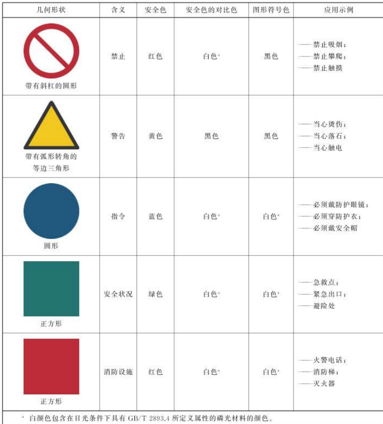
表 1 安全标志的几何形状、安全色和对比色