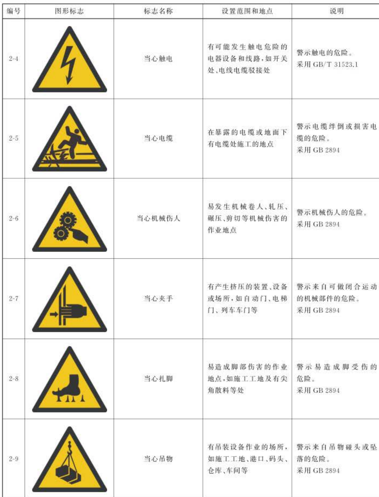
表 3 警告标志的种类及设置地点 (续)