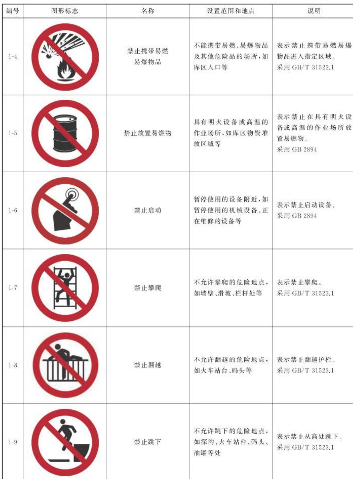
表2 禁止标志的种类及设置地点(续)