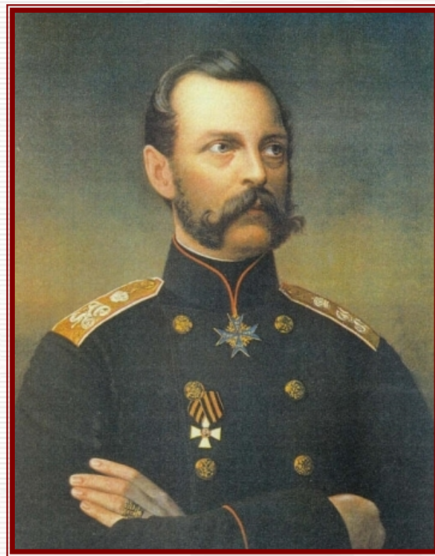
沙皇亚历山大二世