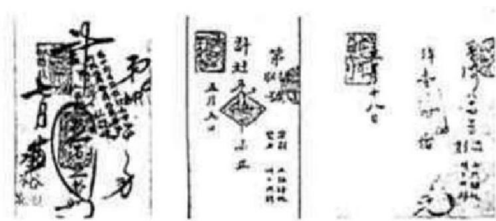
承裕牲记钱庄庄票 恒隆钱庄庄票 天祥钱庄庄票

5. 下图庄票是清朝前期由民间钱庄自己发行的银票，上面写有一定金额并由钱庄负责兑现，是代替货币流通的一种信用凭证，起到了“私营银行钞票”的作用，主要由商人使用，多用于往来交易。这一票据()