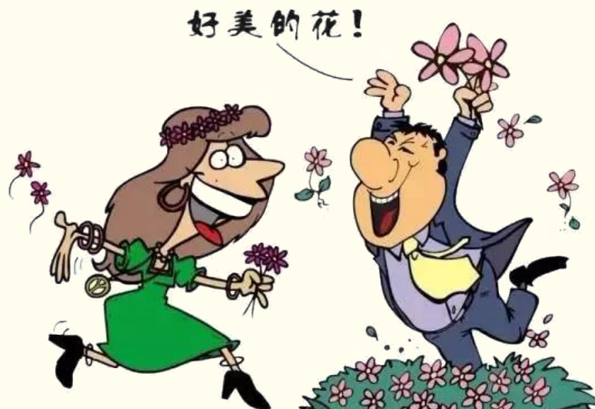
破坏植物，乱摘花草