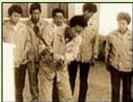
1985年砸掉76台质量不合格冰箱