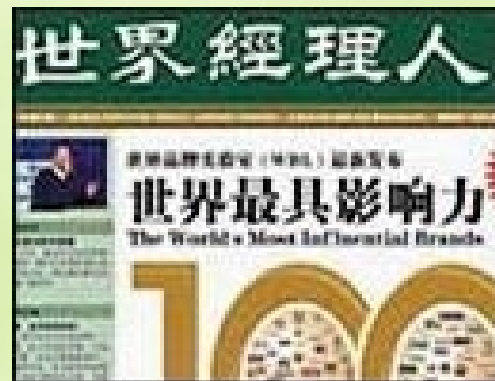
2004年海尔入选世界100最具影响力品牌