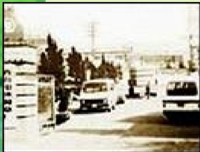
1984年创业初期海尔冰箱厂原貌