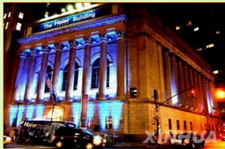
美国纽约海尔集团大厦

二十年来，海尔集团由一个亏空147万元的集体小厂，发展成为2004年全球营业额1016亿元的中国第一品牌，并在全世界获得越来越高的美誉度。