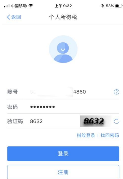
方式一：账号密码登录