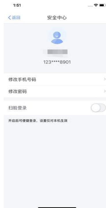
方式三：刷脸登录认证注册