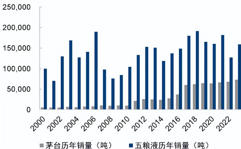
图9：茅台和五粮液历年销量对比（吨）

与市场不同，我们认为品牌影响力需要兼顾量价，与贵州茅台相比，过去 6 年五粮液品牌力并没有出现明显下降。我们把消费品公司的品牌影响力定义为销售量和渠道批发价格的函数，当前市场估值给予价格因素较高的权重，但对于八代五粮液，产品本身相对于飞天茅台的金融属性较弱，其终端需求以消费者开瓶饮用为主，销售量的增加反应消费者触达率的提