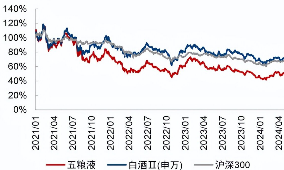
图1：2021年至今五粮液股价跑输白酒指数及沪深300

1.2 估值折价原因：业绩增速放缓后，市场对公司的担忧被放大，但只基于短期增速定价有失偏颇