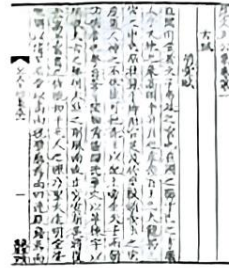
D. 清刻本·范仲淹著 《范文正公集》