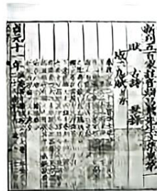
C. 唐·韩愈著 《韩昌黎集》