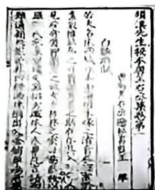
A. 唐·王维著 《王右丞集》

8、文物是一个国家和民族历史的忠实记录者与传播者，它记载着历史的兴衰，刻录着民族发展的轨迹。请根据你对作者的了解，判断下面文物典籍与标识不符的一项是（ ）（3分）