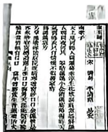
B. 唐刻本·李清照著 《漱玉词》