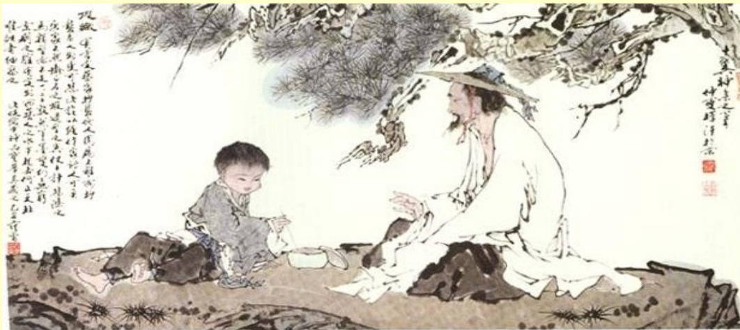
促 织 写《聊斋志异》中故事。老者王成，迂阔而诚实，童子天真而顽皮，二人所演悲喜剧，有令人不忍卒睹者，画家据此题材，足为其真情所感也。

借讲前朝故事来揭发黑暗现实，批判的针芒直指天子。本文是《聊斋志异》中深刻揭发黑暗现实的篇章之一。作品是以斗促织的宫廷嬉戏作为引线，经过波折变化的情节揭发黑暗的社会现实。