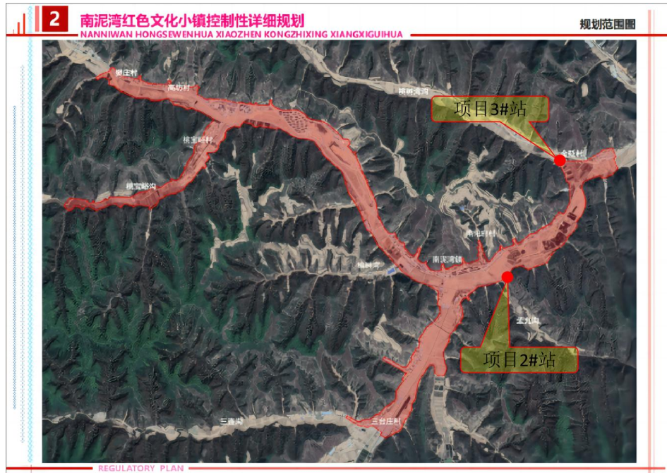
图 1-1 本项目与南泥湾红色文化小镇控制性详细规划范围位置关系图