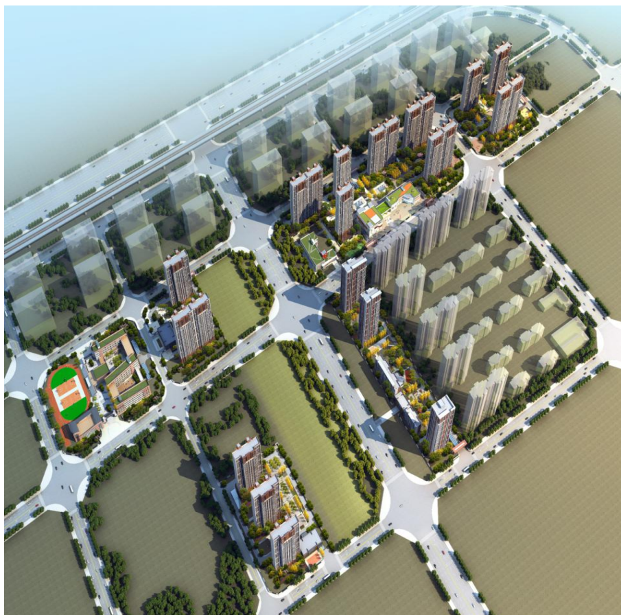
省直青年人才公寓文华苑项目效果图

省直青年人才公寓文华苑项目（BS22-09-04 地块）由河南省豫资青年人才公寓置业有限公司投资兴建，该项目河南省“筑巢引凤”引进人才的重点项目，主要以装配式建筑为主，本地块建筑面积 7.1 m 2 ，3 栋住宅楼，每栋地上 33 层，地下 3 层，建筑高度 96.3 米，主楼结构形式为：预制装配式剪力墙结构，填充墙采用 100/200mm 厚蒸压加气混凝土板（ALC 板）。ALC 板工程量共计：4600m 3 ，冬季施工阶段 ALC 板工程量为：1700m 3 。