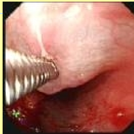
食管静脉曲张的硬化剂治疗