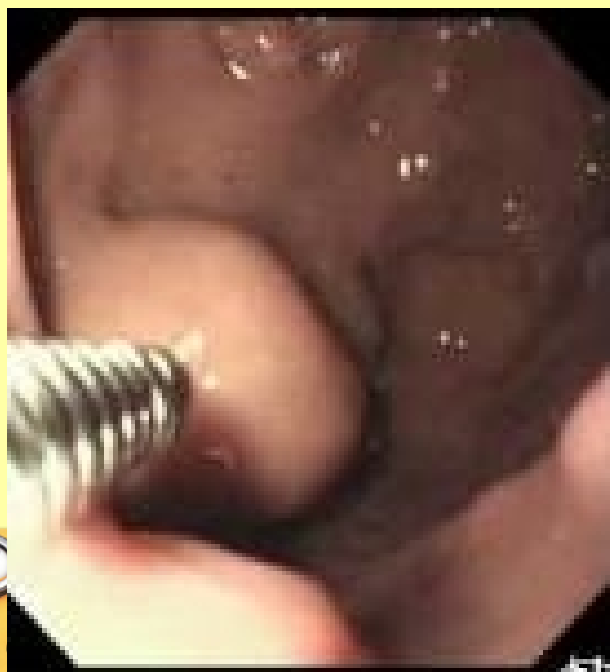
胃底静脉曲张的组织粘合剂注射治疗