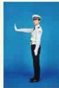
5. 重复（3）动作，完成第二次摆动；