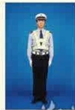
6. 收右臂，头部及目光转回前方；