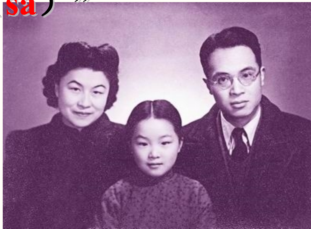
钱钟书夫妇和女儿 钱媛