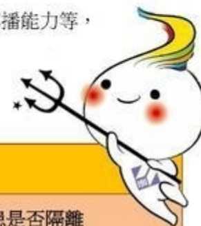
國內法定傳染病 5 分類

《傳染病防治法》根據傳染病嚴重程度、致死率、傳播能力等，將依傳染病區分為 5 類：