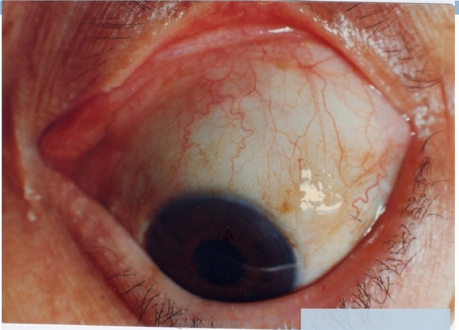
急性出血性结膜炎