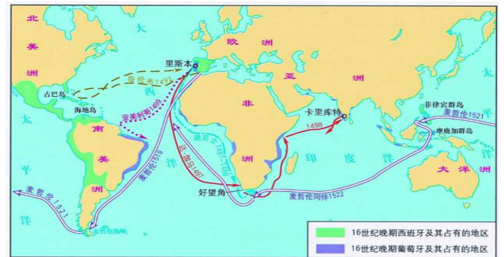
公元15世纪之后世界主要贸易路线

变化： 贸易范围有公元15世纪之前的各州内部和亚欧之间， 变化为15世纪之后的全球贸易。