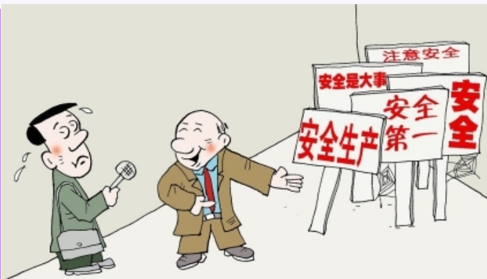
——我们厂一直很重视安全生产！ 唐春成 作