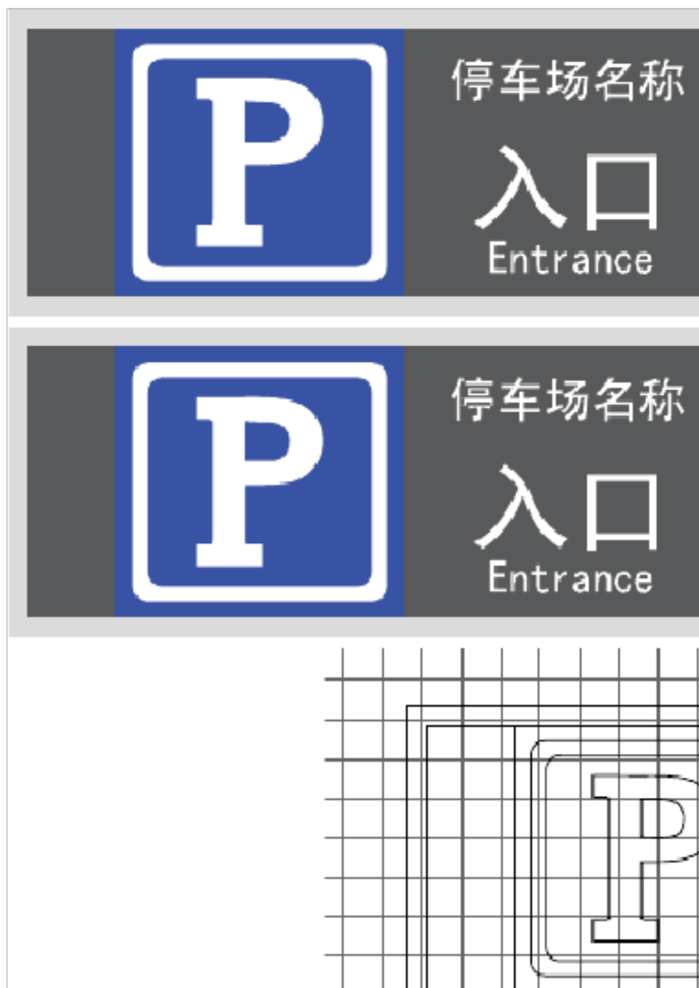
图 A. 34 人员位置引导标志