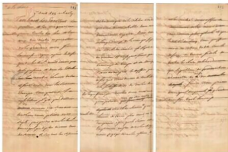
图7 1688年法国国王路易十四致康熙皇帝信函