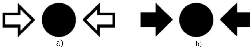
图 3 消火栓按钮标识

4.12.2.6 消火栓按钮的操作面板上应标注图3a) 或图3b) 所示的图形符号。图形标识可附有补充性文字(如: 按下启动)。符号和文字总面积不应超过操作面板总面积的10%。