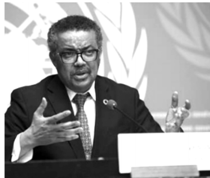
图 3 - 2 - 1 谭德塞·阿达诺姆

现任世界卫生组织总干事的谭德塞·阿达诺姆，是世界卫生组织首位来自非洲的总干事。浓重的口音、锃亮的黑框眼镜、时而怒目圆瞪、时而憨态可掬……谭德塞无疑是世界卫生组织历任八位总干事中曝光度最高且最具个性的一位。据此，读图3-2-1，完成2~4题。