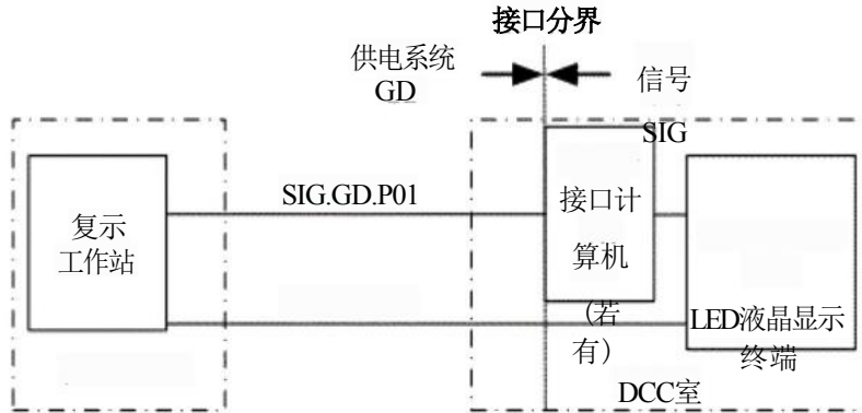
图1 信号系统与供电系统的接口界面图