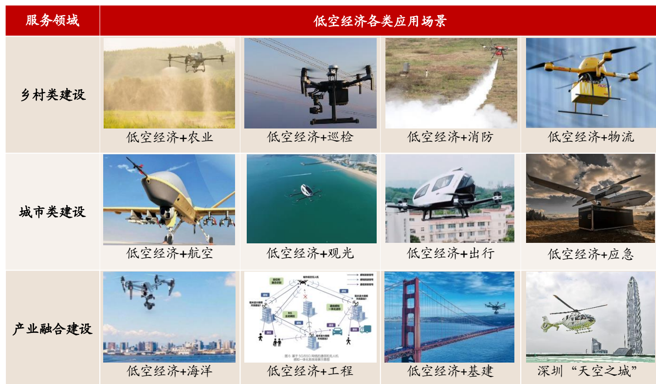
图4：低空经济应用场景：具有产业链条长、辐射面广、成长性和带动性强的特点