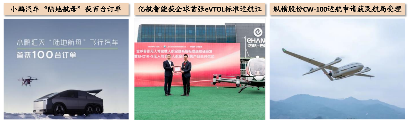
图3：低空经济—eVTOL、无人机等企业近况

照 18.2 万本。2023 年无人机驾驶航空器飞行超过 2000 万小时；2) 2023 年 12 月 29 日，纵横股份主编的无人机行业标准 HB 8736-2023 正式发布；2024 年 1 月 5 日，纵横股份 CW-100 无人机系统适航申请获民航局受理。