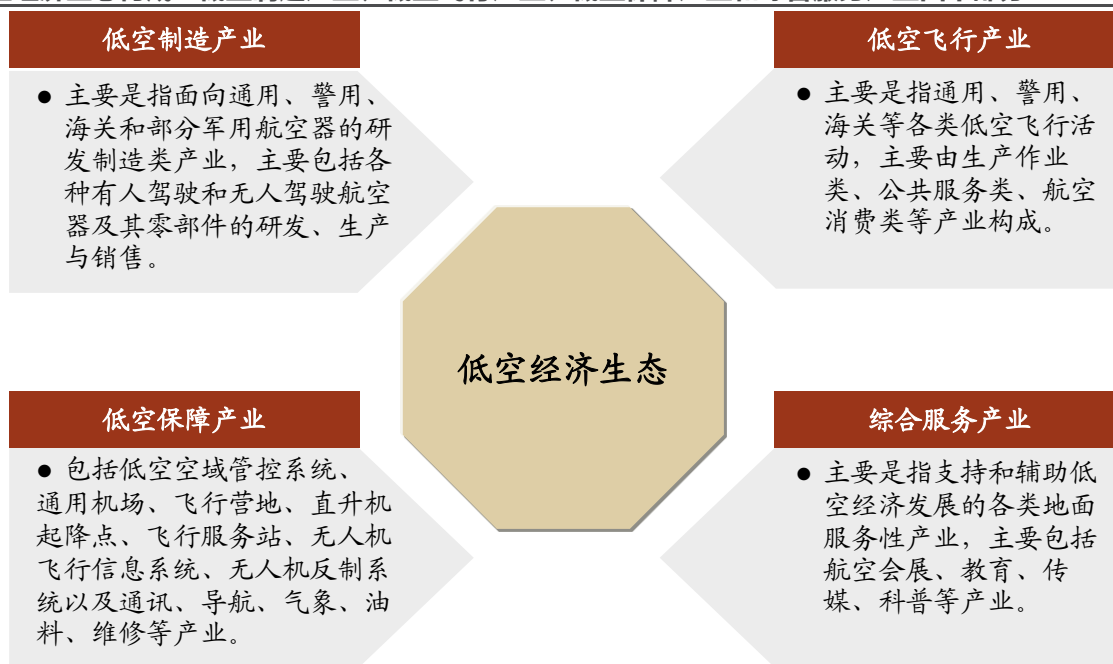
图1: 低空经济生态构成: 低空制造产业、低空飞行产业、低空保障产业和综合服务产业四个部分

低空经济广泛体现于第一/二/三产业中,重点发展领域主要包括制造、飞行、保障和综合服务四部分。具体来看:1) 低空制造产业 主要是为低空飞行活动提供航空器等产品和服务,包括面向通航、警务、海关等领域所需各类航空器的研制与销售等;2) 低空飞行产业 是低空经济的核心产业,主要包含生产作业类、公共服务类、航空消费类等细化产业门类和服务链条;3) 低空保障产业 主要包括低空空域管控系统、通用机场、飞行营地、直升机起降点、飞行服务站、无人机飞行信息系统、无人机反制系统等建设与运行;4) 综合服务产业 范围较广,是指支持和辅助低空经济发展的各类地面服务性产业,主要包括航空会展、教育、文化传媒、科教等产业。