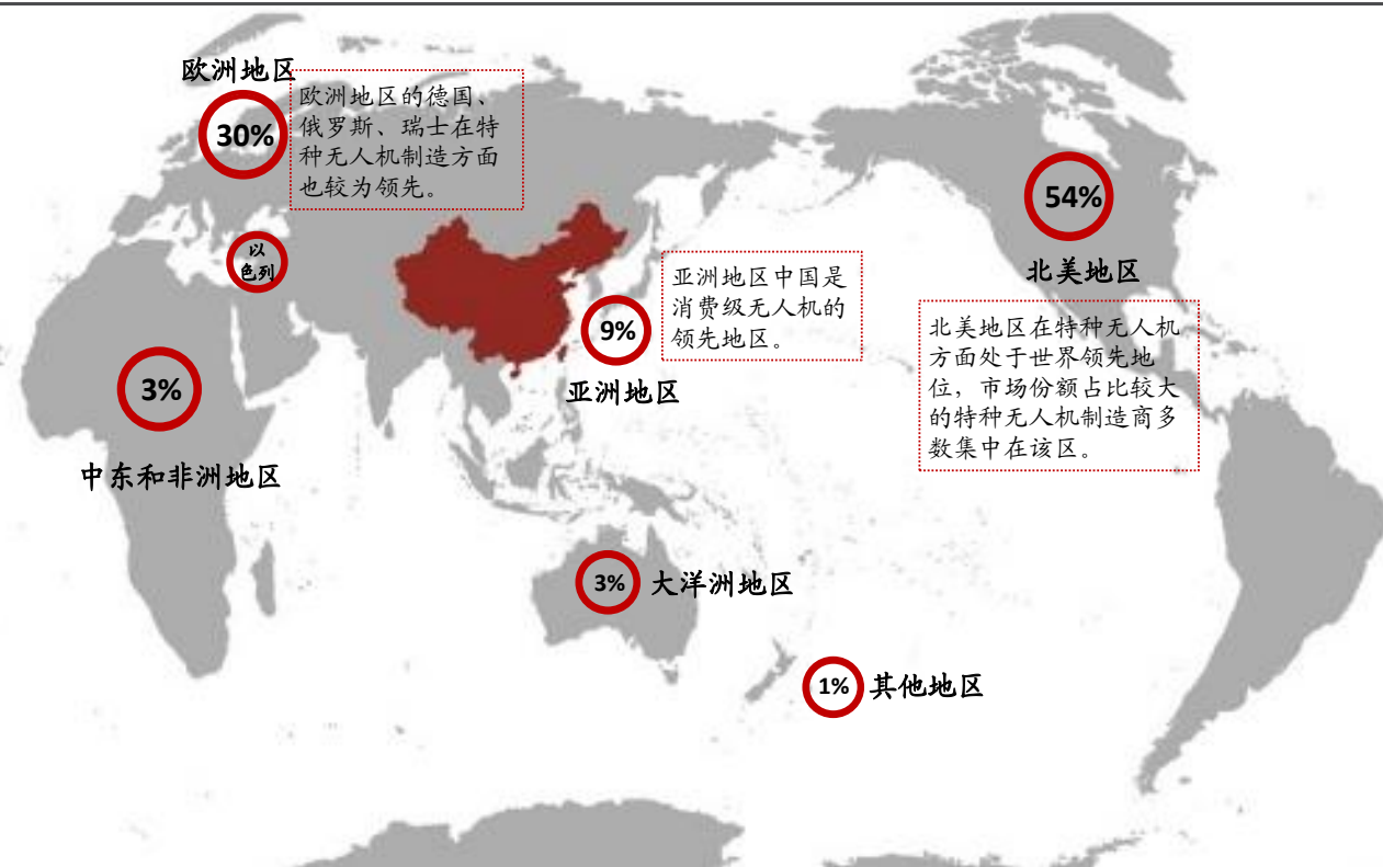
图9：全球无人机研制布局：集中在欧美、中国等地区

泛用于测绘与地理信息、巡检、安防监控、应急、快递物流等领域。近年来，工业级无人机市场更多迈向运营与服务方向，更加注重数据的采集与分析，“飞行器+产业融合”的模式开始逐步显现，应用端如低空物流、智慧巡检、智慧监测系统等方向的需求显著提升。我国主要工业级无人机包括：大鹏（纵横股份）、经纬M300 RTK（大疆创新）、GD-XV（观典防务）、Ifly V5（中海达）等。2019年，纵横股份在我国垂直起降固定翼无人机市场占比53.8%，位列第一；在我国工业级无人机整机市场占比5.4%，位列第二。我国无人机发展正呈现出百花齐放、百家争鸣的良好态势。2023年，《无人驾驶航空器飞行管理暂行条例》颁布，这是我国无人驾驶航空器管理的第一部专门行政法规，明文规范了无人航空器适航认证及飞行管理规则，标志着我国无人机产业进入规范化发展阶段。我们认为，伴随低空空域资源的开发、无人机注册和飞手培训体系的优化，我国无人机产业有望向智慧城市、智慧巡检、应急、安防、物流、农业等多个生产生活领域延伸，或将对低空经济发展形成强劲助推力。