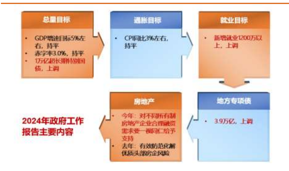
图 1 2024 年政府工作报告主要内容

房地产发展难题、促进房地产市场平稳健康发展的治本之策。过去在解决“有没有”时期追求速度和数量的发展模式，已不适应现在解决“好不好”问题、高质量发展阶段的新要求，亟需构建新的发展模式。房地产发展新模式应该注重市场供需关系，以满足刚性和改善性住房需求为重点，努力让人民群众住上好房子。“以人定房，以房定地、以房定钱，防止市场大起大落”。此外，今年政府要求对不同所有制房地产企业合理融资需求要一视同仁给予支持，相比去年有效防范化解优质头部房企风险的表述有重要的转变，这也体现出守住房地产不发生系统性风险的底线思维。