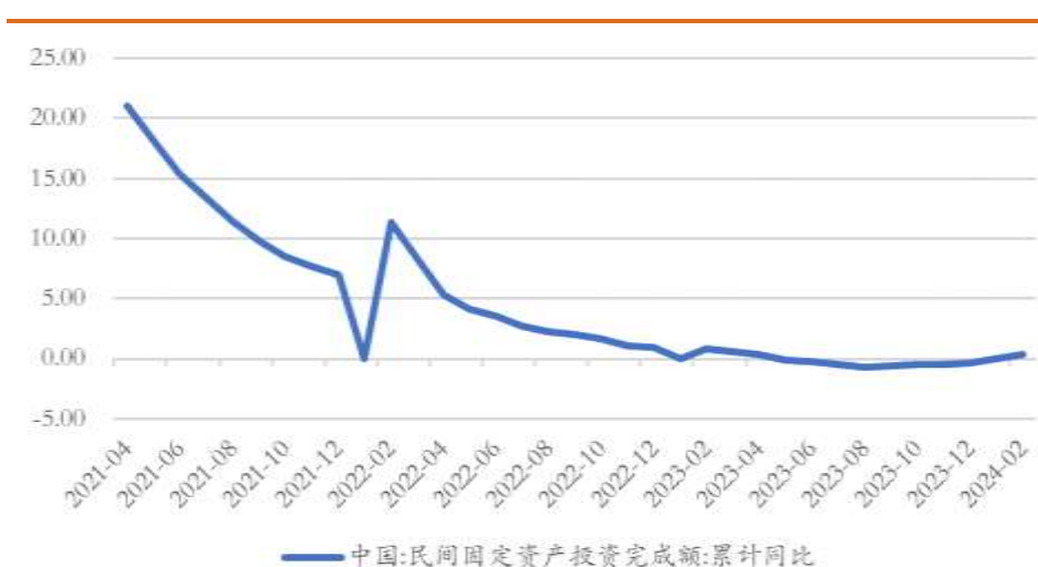
图 10 我国民间固定资产投资增速累计同比 (%)