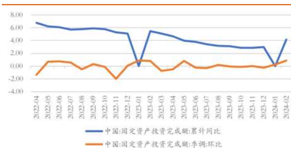
图 9 固定资产投资同、环比增速 (%)

今年 1-2 月全国固定资产投资（不含农户）50847 亿元，同比增长 4.2%。较去年全年 3.0% 的增速水平上升 1.2 个百分点，但较去年同期 5.5% 的同比增速有点回落。从环比角度看，1 月和 2 月的固定资产投资增速分别为 0.24% 和 0.88%，表明整体投资增速在边际提升。另外，值得关注的是民间投资增速已经由负转正，1-2 月累计同比增速录得 0.4%，而去年民间投资增速为 -0.4%，民间投资热情的逐步恢复意味着我国内生增长动能正在改善。