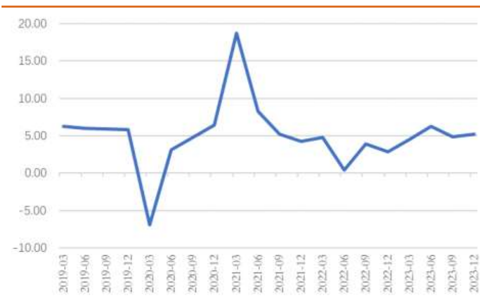
图 2 我国 GDP 不变价当季同比 (%)