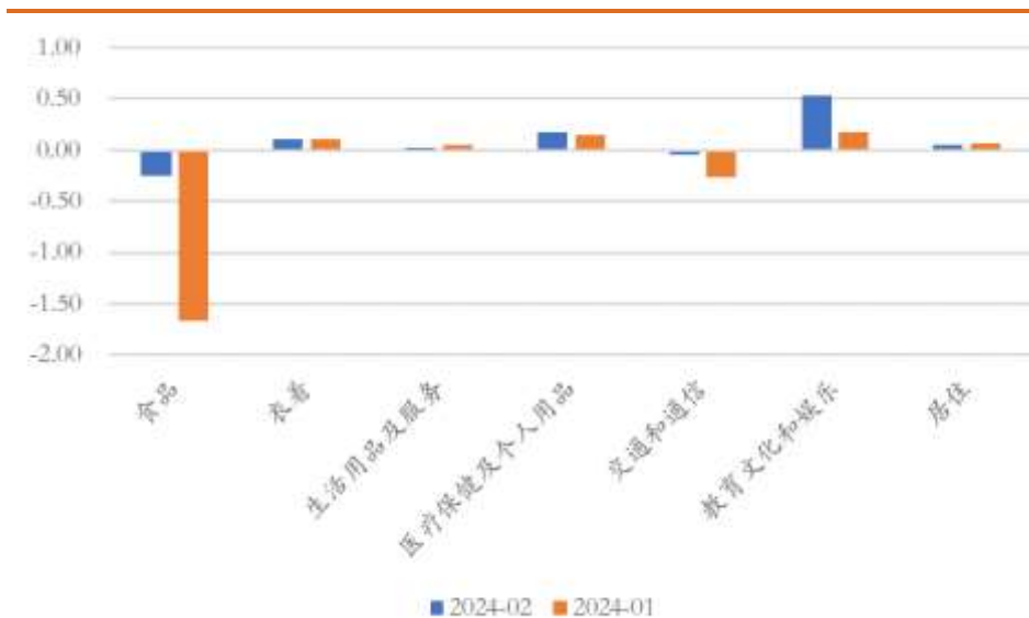
图4 我国CPI分项对整体读数的拉动效应 (%)

食品项对CPI拉动的改善最为明显。1月食品拖累CPI达1.66个百分点，2月其拖累效应大幅缩小到0.25个百分点，改善程度达到1.41个百分点。在食品项中，猪肉价格和鲜菜价格的同比上升是一大亮点，猪肉价格由1月份的-17.3%大幅上升至2月份的+0.2%，提高了17.5个百分点。鲜菜价格同比由1月份的-12.7%上升到2月份的+2.9%，提高了15.6个百分点。一方面可以由春节错位解释，另一方面也可以由局部地区雨雪天气等气候因素解释。