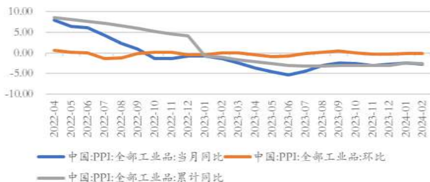
图 7 PPI 同、环比走势 (%)