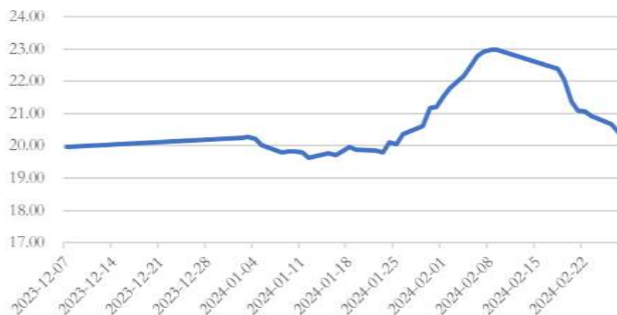
图 6 我国猪肉平均批发价走势（元/公斤）