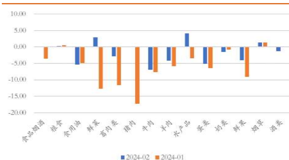
图5 CPI食品分项近两月同比走势 (%)