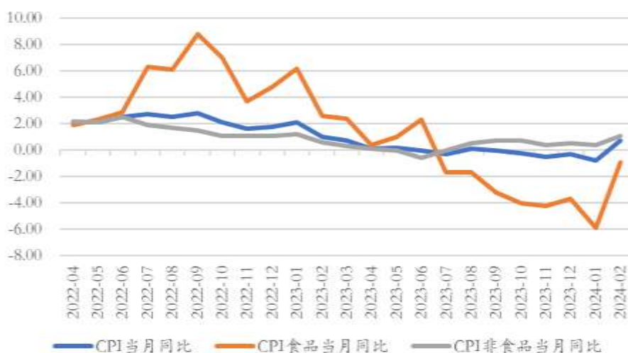
图3 我国CPI及其分项同比走势（%）

今年2月国内CPI当月同比上涨0.7%，较前值大幅上行1.5个百分点，结束了连续4个月的负增长。CPI同比转正主要是因为春节错位原因所致。一般而言，春节对于食品和服务的需求比较旺盛，CPI会展示出季节性的升高。去年春节在1月份，去年1月和2月CPI同比分别为2.1%和1.0%；今年春节在2月份，映射到今年1月和2月CPI同比分别为-0.8和0.7%。1-2月累计同比增速为零。2月CPI食品项同比增速为-0.9%，较前值大幅收敛5个百分点；CPI非食品项同比增速为1.1%，较前值上涨0.7个百分点。剔除食品和能源扰动的核心CPI同比增速录得1.2%，较前值上升0.8个百分点。