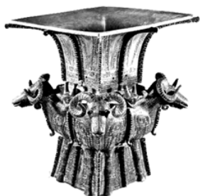
青铜雕塑：四羊方尊， 有动物纹饰