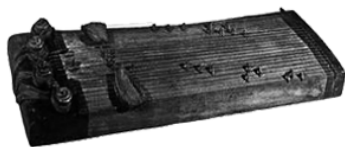
乐器：二十五弦瑟， 中国古代礼乐之器