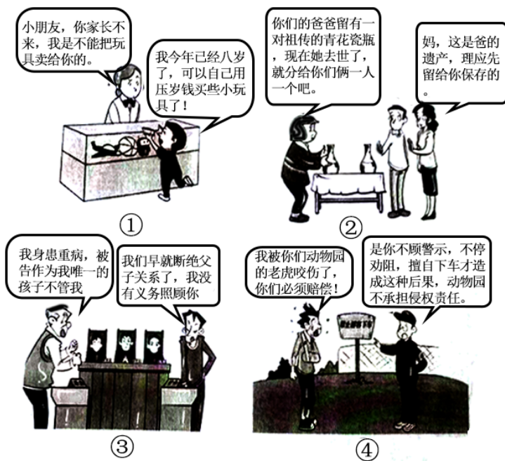
(题中漫画来自司法部普法与依法治理局所编图书，有改动)