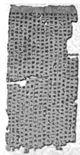
帛书：《黄帝四经》（局部）， 记载汉初黄老思想