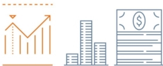
Analytics and finance

利润表是反映企业在一定会计期间经营成果的财务报表，它列示了企业在一定时期内的收入、费用和利润或亏损的增减变动情况。