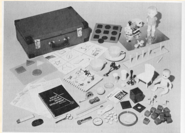
FIG. 35. Test Objects Employed with the Bayley Scales of Infant Development.