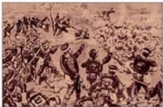
日军随军画家笔下的平壤大战。