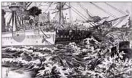
1894年7月25日，清政府雇用英国商船高升号运送中国士兵去朝鲜，在丰岛附近海面被埋伏的日舰击沉，船上大部分官兵殉难。