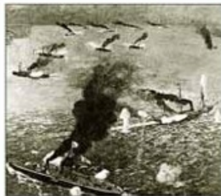
中日战舰在黄海激战