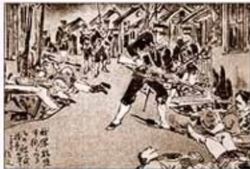
日军侵入旅顺市街道的情景