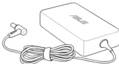
Adaptor de alimentare CA*