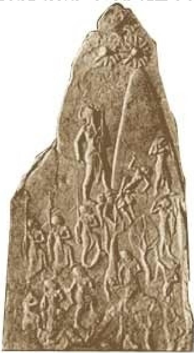
丁 勿 悉 伊 工