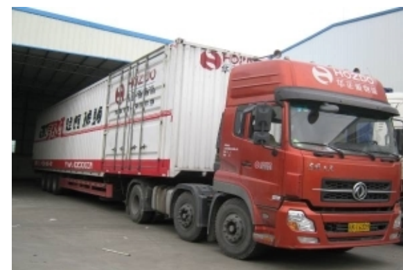
长途干线运输车辆