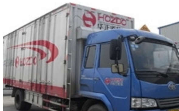
危险品车辆 完整版课件