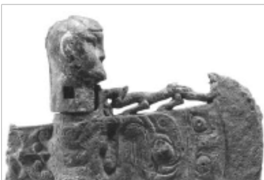
人头盥内钺·西周前期

2. 商周时期的青铜器已经出现一定的人物形象。如图所示，西周中期以前，人物周身添加了大量的神秘纹样，表现为一种夸张且神秘威严的形式。西周中期以后，青铜器上的人物形象没有了之前的狞厉，逐渐表现出写实主义风格。这一转变反映了商周时期