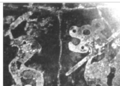
画像铜壶（局部）·春秋晚期