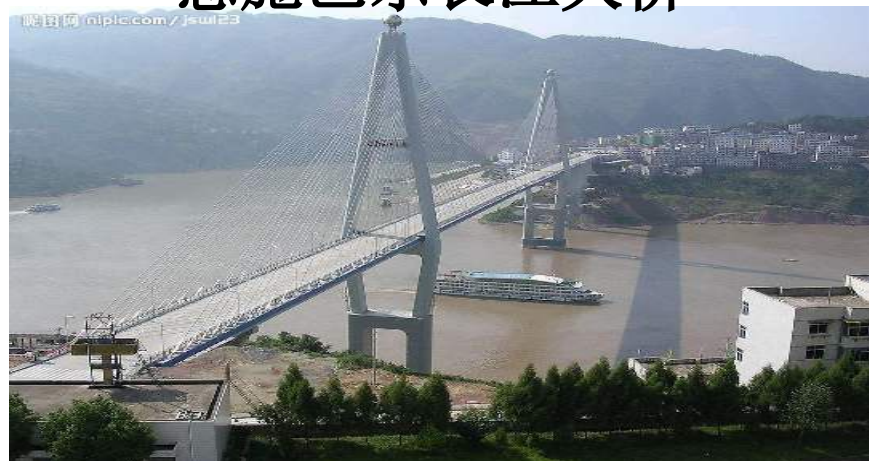
恩施巴东长江大桥