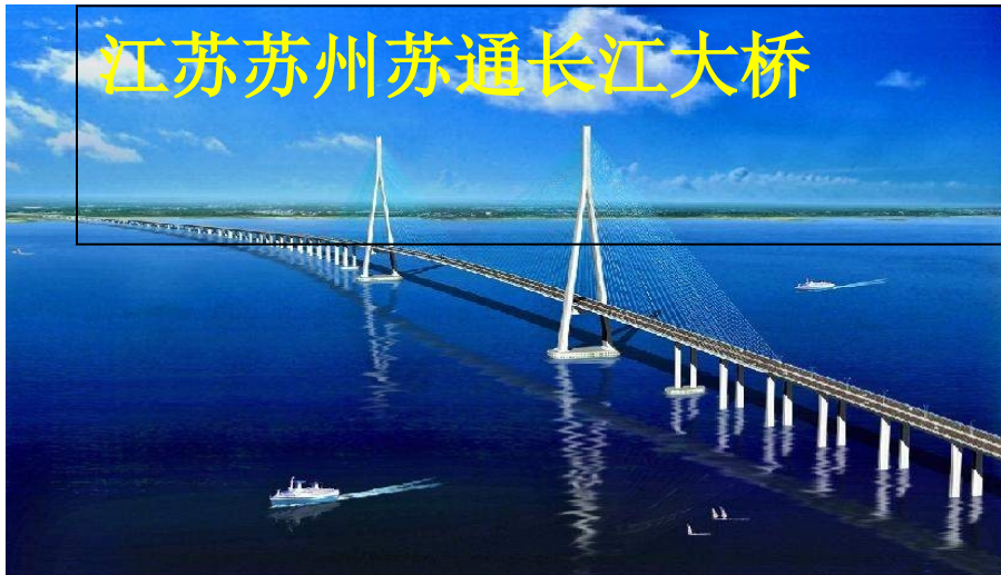
江苏苏州苏通长江大桥