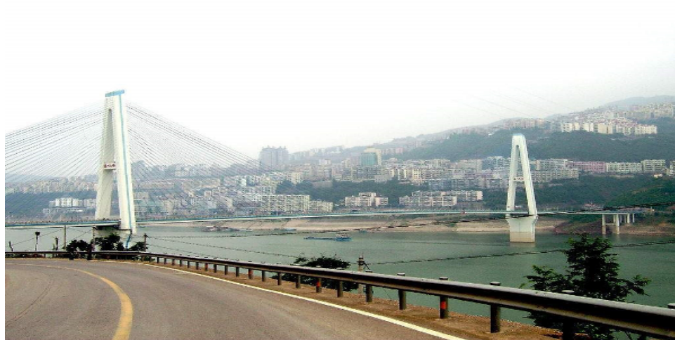
重庆奉节长江大桥