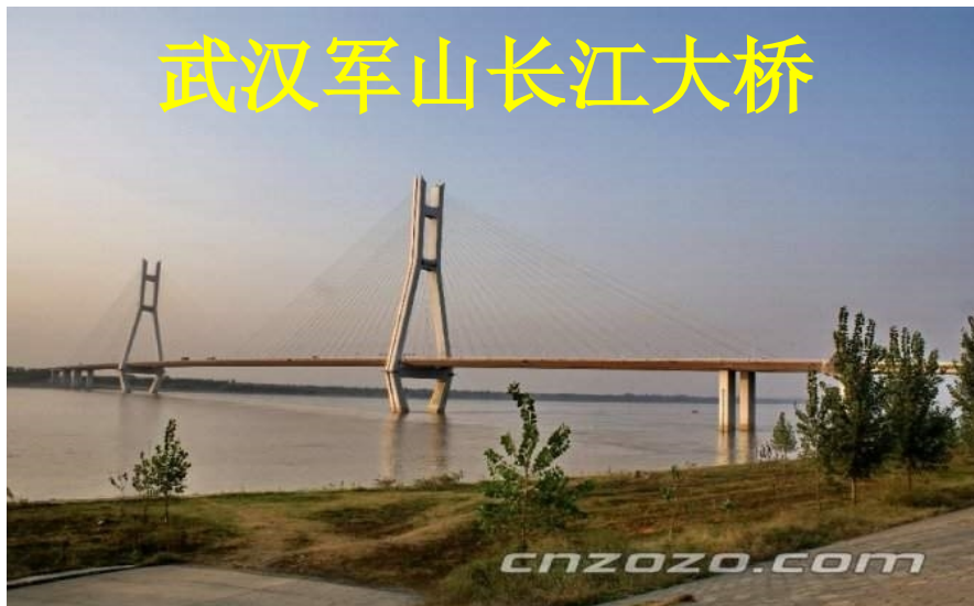
武汉军山长江大桥