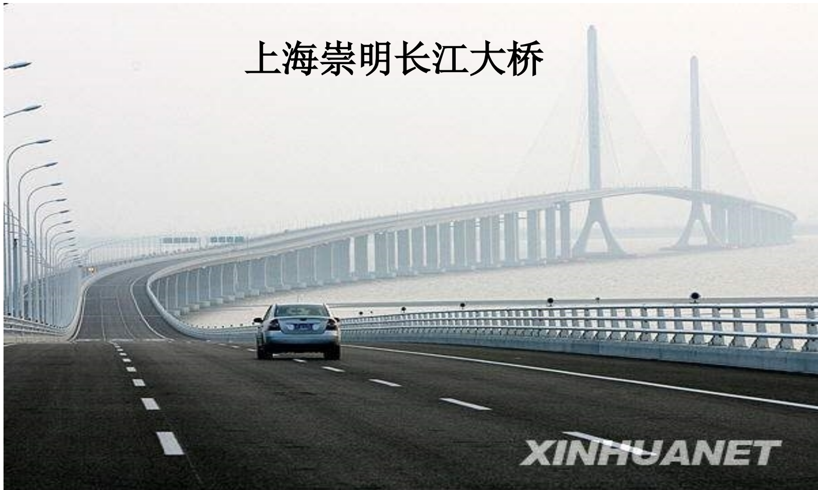
上海崇明长江大桥